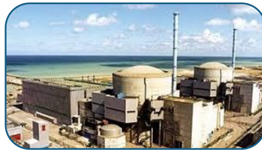
Grand Carénage EPR2