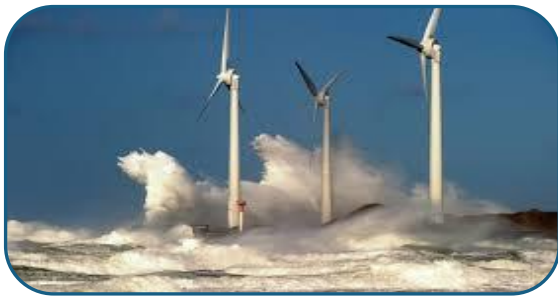
Eoliennes en mer

DME PARTENAIRE DES GRANDS DONNEURS D'ORDES