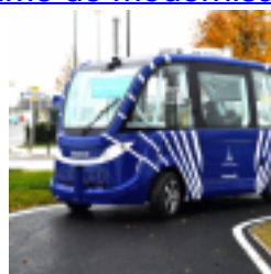
Express le cadre est fixé